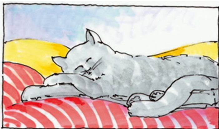
Pelo di animali