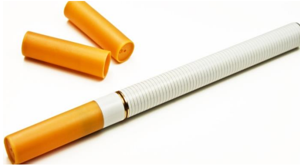
1 ère génération