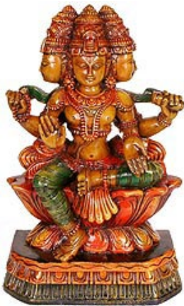
Dans l'hindouisme, «ātman» signifie «respiration/souffle vital» et désigne l'essence de l'être, qui demeure en vie après la détérioration du corps physique.