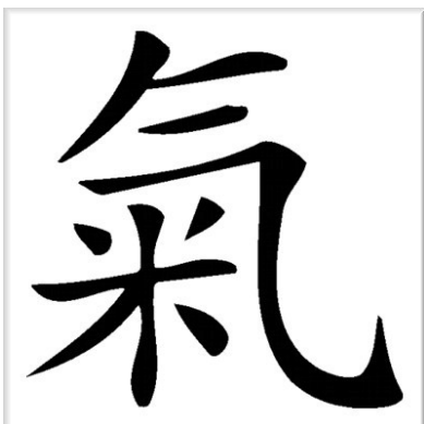
Dans la pensée chinoise, qi (prononcer «tchi») signifie «souffle vital», «énergie qui circule dans tout l'univers».